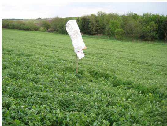
Billede 1. Eksempel på Skræmmemiddel - fodersæk på pind.

Se 'European Agricultural Fund for Rural Development'